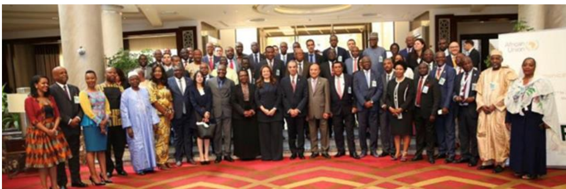
（AU の DX 戦略について開催された担当閣僚会合（2019 年 10 月）。AU ホームページより）

（本エッセイは、AU 代表部員個人の見解を記したものであり、必ずしも当代表部または日本政府の立場を反映したものではありません。）