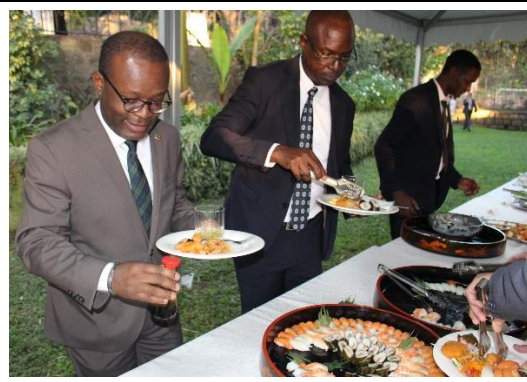
寿司を楽しむゲスト