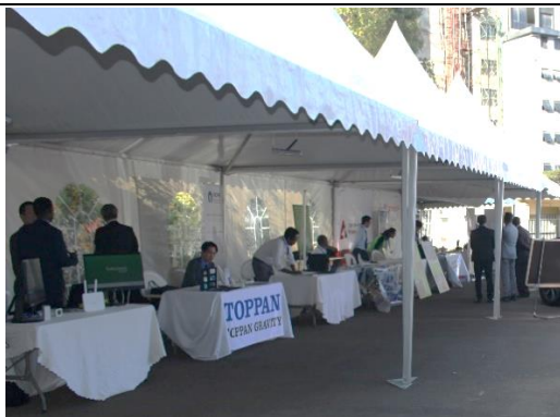
日本企業及びNGOによる展覧ブース