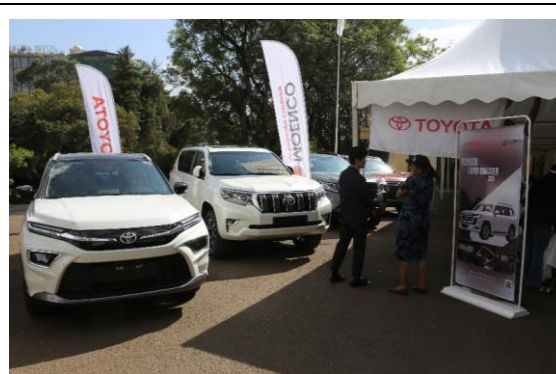
日本ブランド車の展示